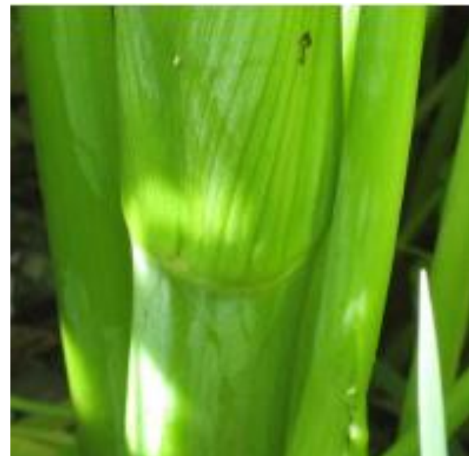
Strand-Kvan: Hul, glat og kan være rødlig/purpur anløbende.