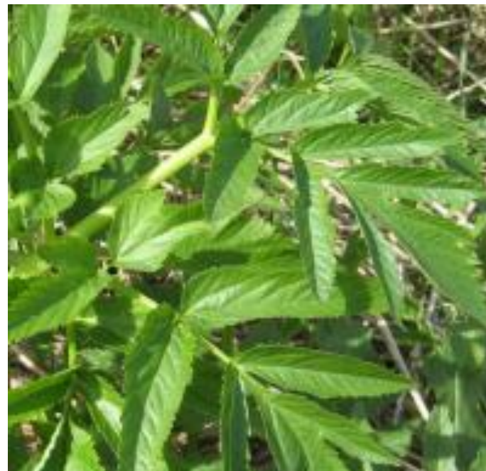
Strand-Kvan: Delte blade, der i en A-form består af mange parallelle aflange småblade med fine takker. Glat under- og overside.