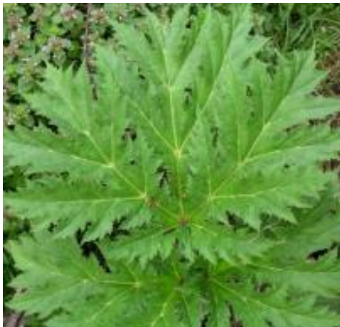
Kæmpe-Bjørneklo: Store meget takkede blade med glat overside og håret/dunet underside.