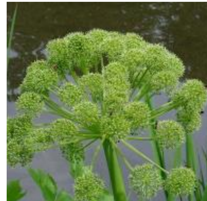
Strand-Kvan: Mere lysegrøn skærm end hvid, næsten kugleformet.