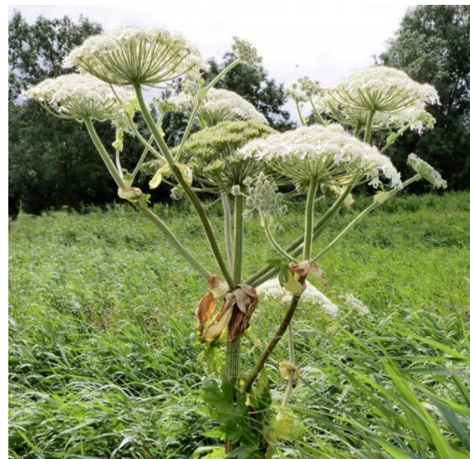
Kæmpe-Bjørneklo: Meget store skærme med hvide blomster.